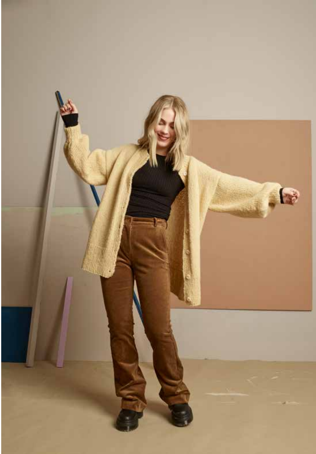
322-6 Birgittejakke i Puno Petit og Alpaca Silk