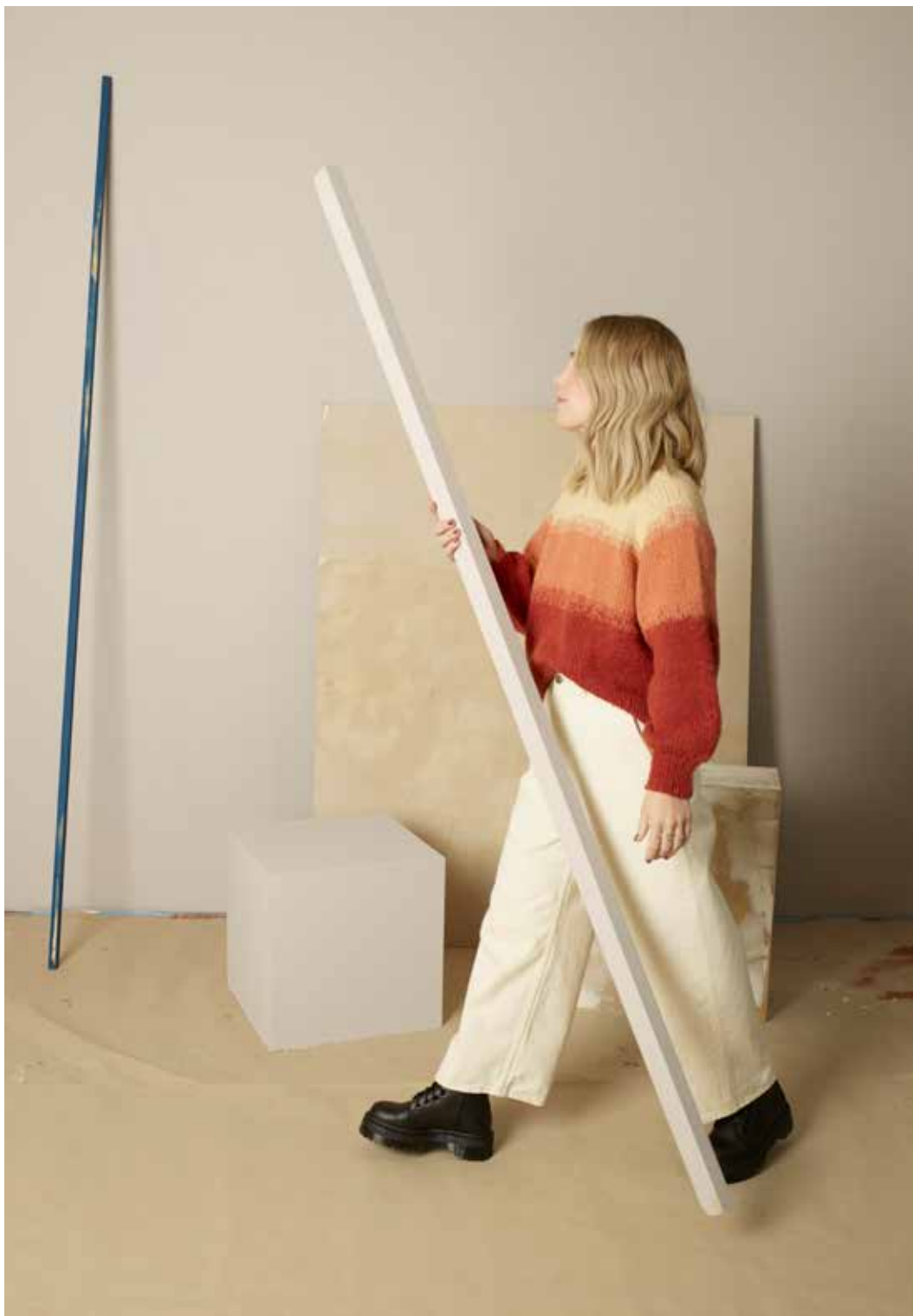
322-2 Debbiegenser i trippel Alpaca Silk