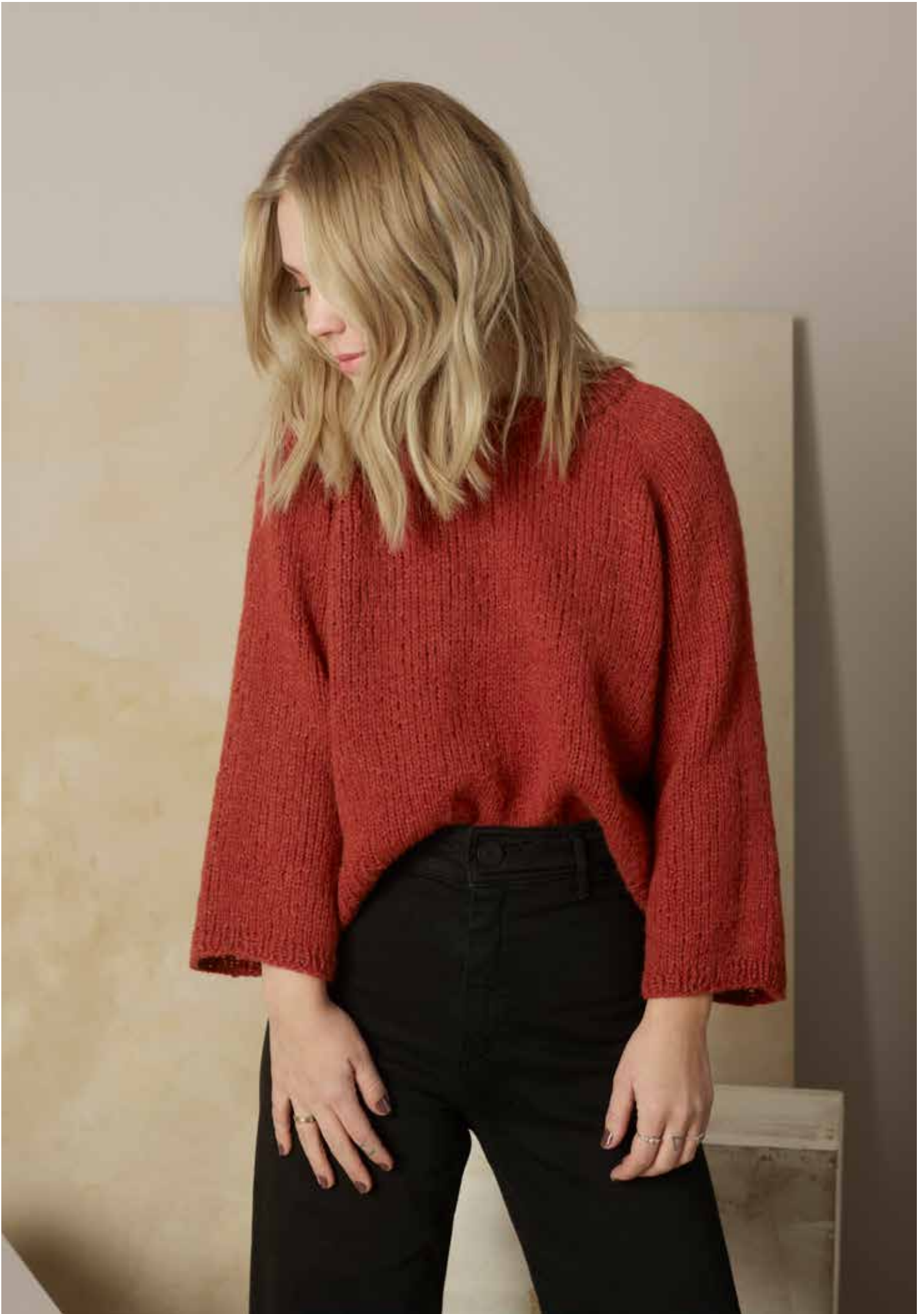
322-1 Pattygenser i trippel Alpaca Silk