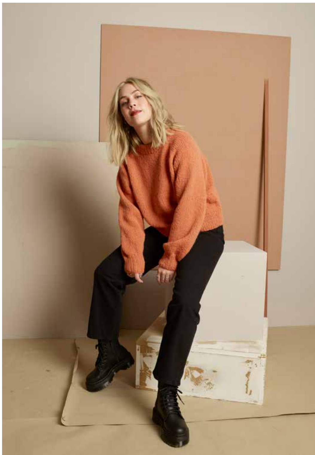
322-3 Agnethagenser i trippel Alpaca Silk

Se forhandlerliste på www.raumagarn.no Del arbeidet ditt på Instagram #raumagarn