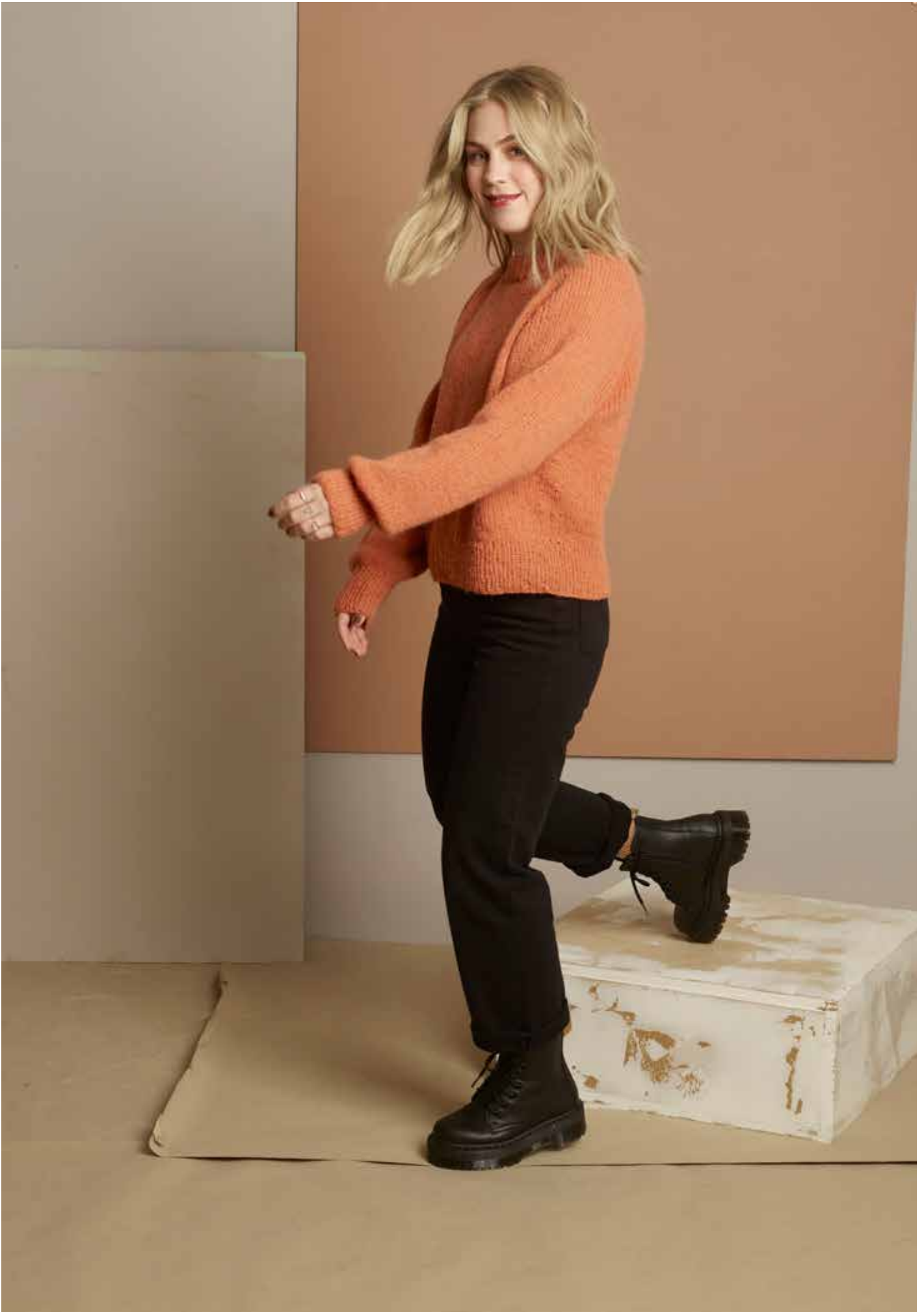
322-3 Agnethagenser i trippel Alpaca Silk