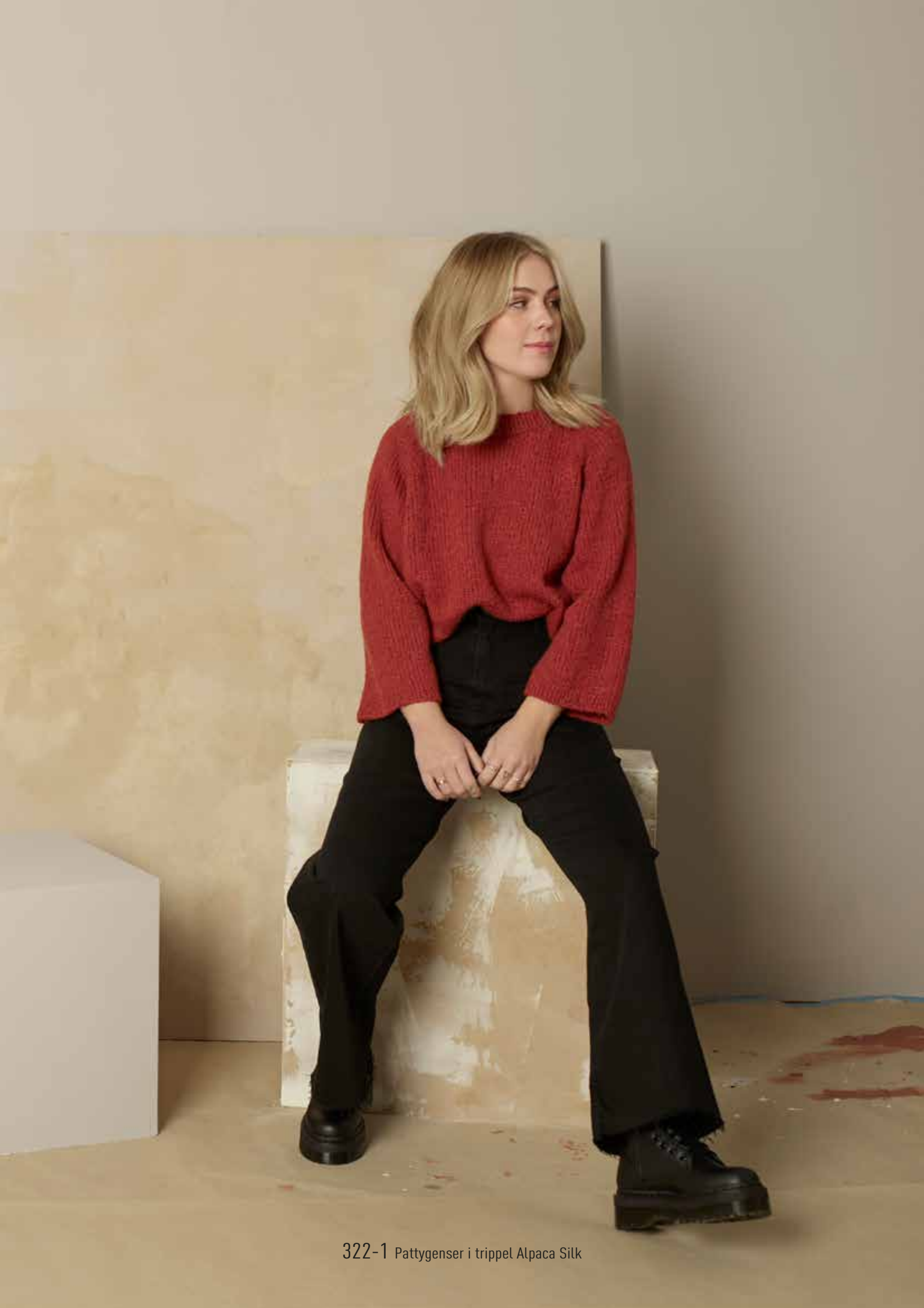
322-1 Pattygenser i trippel Alpaca Silk