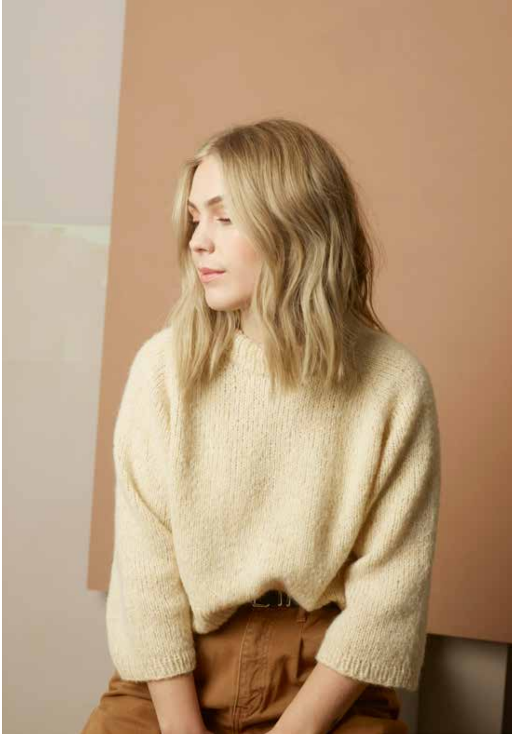
322-1 Pattygenser i trippel Alpaca Silk