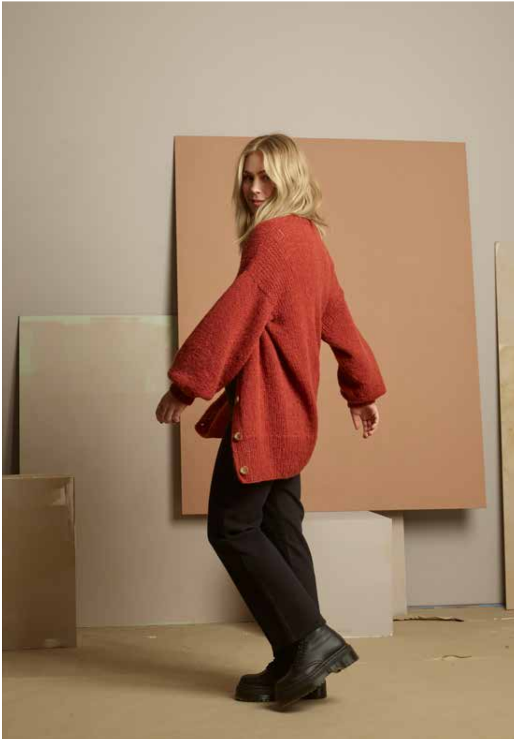
322-6 Birgittejakke i Puno Petit og Alpaca Silk