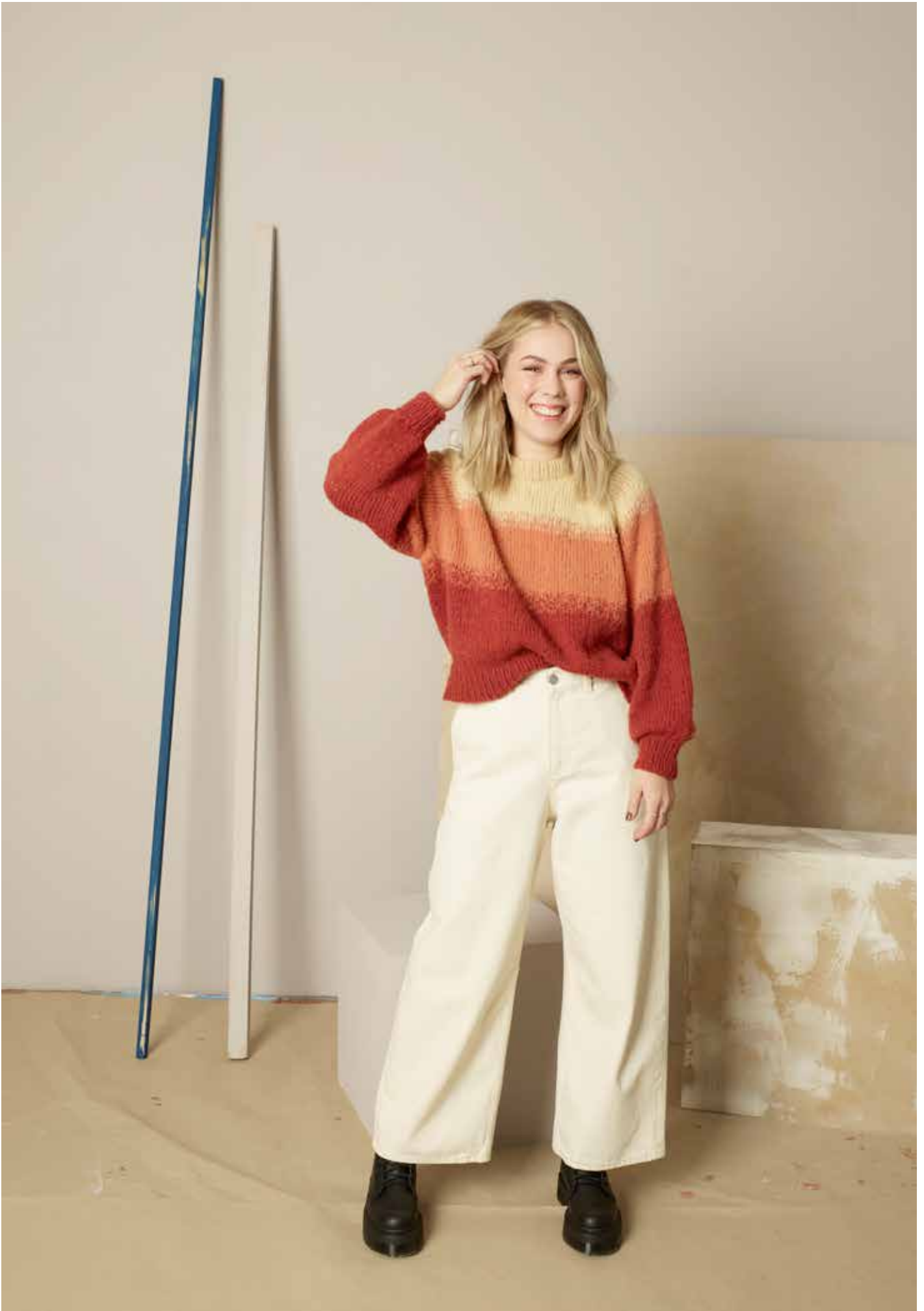
322-2 Debbiegenser i trippel Alpaca Silk